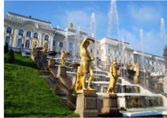
Um inci tat. Ibh eummodo od magna consequis aliqui eum dolortisi. Em dunt velisi. Iliquisit irilis nulla